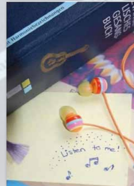
Foto einer Konfirmandin